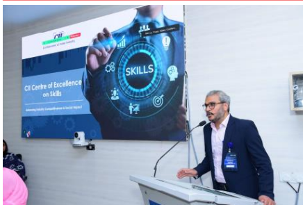
Enabling quality regulation through recognition of Awarding Bodies—NCVET